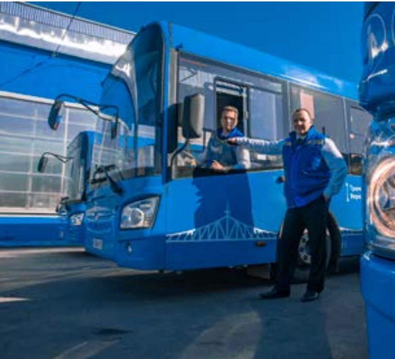
Благодаря запуску новой транспортной модели «Транспорт Верхневолжья» было создано более 1500 рабочих мест, 900 из которых водители

тута экономики транспорта и транспортной политики НИУ «Высшая школа экономики».