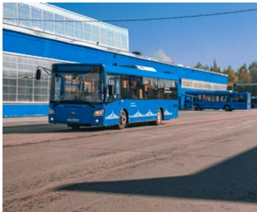
Новая транспортная модель «Транспорт Верхневолжья» одержала победу в номинации «Лучшее решение в области пассажирского транспорта»