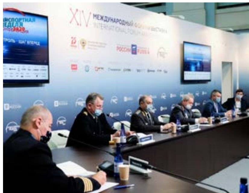
На отраслевой конференции Федеральной службы по надзору в сфере транспорта «Дистанционный контроль – шаг вперед»

В рамках «Транспортной недели – 2020» организатором отраслевой конференции «Дистанционный контроль – шаг вперед» стала Федеральная служба по надзору в сфере транспорта.