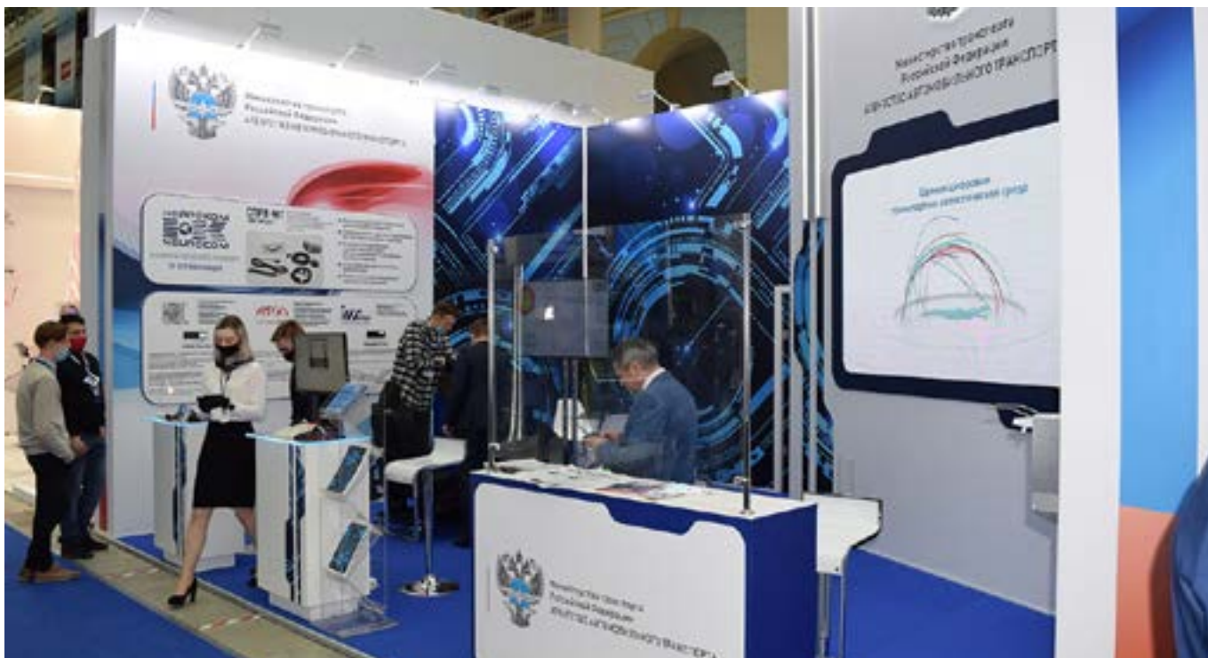
На выставке «Транспорт России». Стенд Росавтотранса

Росавтотранс традиционно принял участие в форуме и выставке «Транспорт России», представляя свой стенд. В его экспозиции была размещена информация об участии агентства в реализации проекта Минтранса России по внедрению на территории Российской Фе-