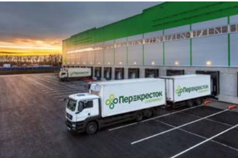
На сегодняшний день в России электронные транспортные накладные внедрены и используются локально между различными коммерческими компаниями по договоренности

повысить прозрачность, четкость и эффективность функционирования транспортной системы городов.