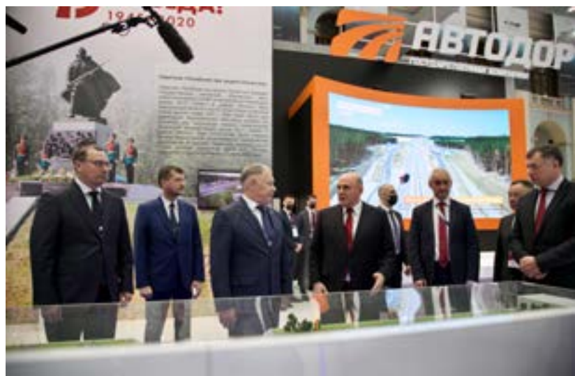
Осмотр выставки «Транспорт России» Председателем Правительства РФ Михаилом Мишустиним

В программу вошли мероприятия, касающиеся всех видов транспорта, включая автомобильный. Помимо пленарных заседаний и конференций была организована выставка «Транспорт России», которую осмотрел Председатель Правительства РФ Михаил Мишустин. Среди участников выставки – производители транспортных средств, грузовые и пассажирские перевозчи-