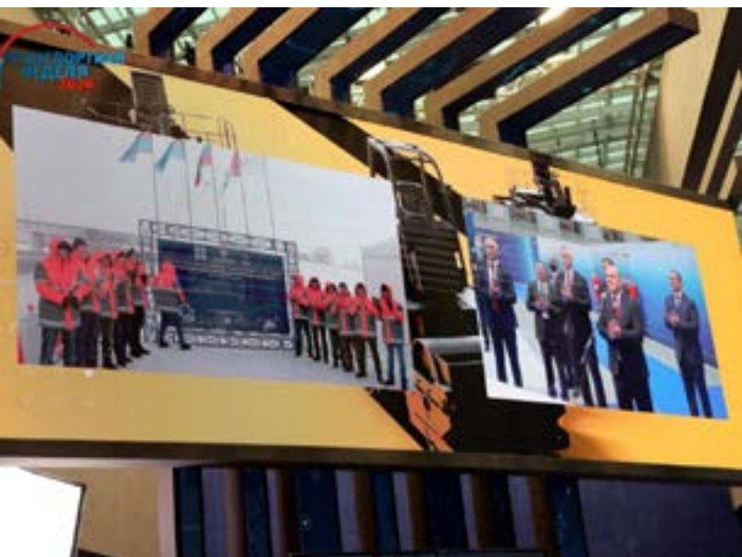
Ввод в эксплуатацию реконструированного 13,5-километрового участка федеральной трассы Р-254 «Иртыш» в режиме телемоста

Во время обхода выставки Председателю правительства РФ были представлены в том числе национальные проекты в сфере транспорта на стенде Минтранса РФ. Один из таких проектов – строительство трассы М-12, которая уже в 2024 году соединит Москву и Казань. Открытие движения по данной трассе сократит время в пути от Москвы до Казани с 12 до 6 часов.