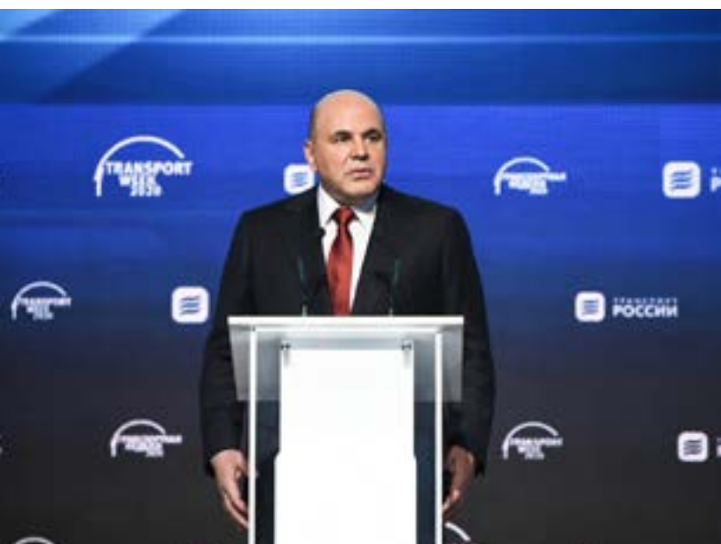
Выступление Михаила Мишустина перед участниками «Транспортной недели – 2020»

Еще один проект, который реализует Госкомпания «Автодор», – строительство Центральной кольцевой автомобильной дороги (ЦКАД). Во время осмотра экспозиции вице-премьер РФ Марат Хуснуллин проинформировал Михаила Мишустина, что третий пусковой комплекс ЦКАД оборудован датчиками, которые позволяют ездить по трассе беспилотному транспорту. Председатель Правительства РФ высоко оценил это, отметив, что искусственный интеллект и современные технологии дадут совершенно другой уровень комфорта и грузопотока.